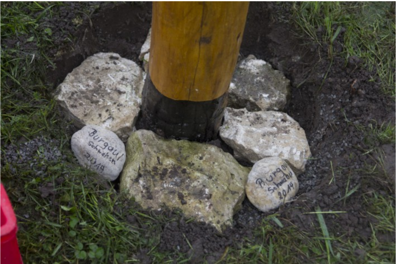
Im Fundament des Wegweisers ist die Partnerschaft zum schwäbischen Burgau verankert