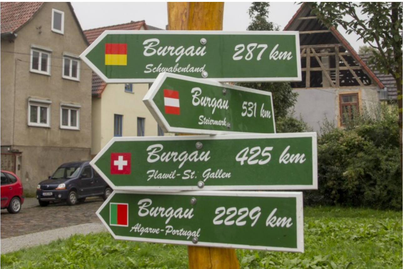
Entfernung und Richtung wurden nach bestem Wissen eingemessen.