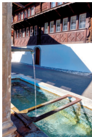
图14 翻新后，立面的原有砌块结构，清晰可见。次级屋顶是新的。前景是一个村庄喷泉的照片

通过一个开放的、有盖的门廊。平面图相对简单，符合设计要求。一个特点是顶层的阁楼，它服务于宗教目的，也用于学校教育目的。