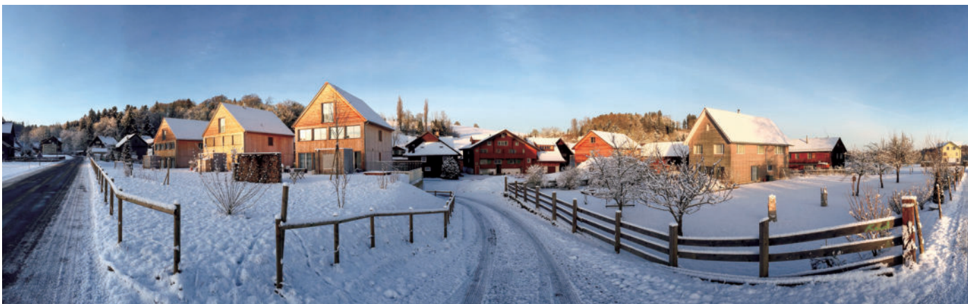
图20 2016年，更新改造后的布尔高。新的居住区，保留原貌和传统的木结构建筑，同时又拥有现代建筑的表现形式

天篷。历史上用于纺织品生产作坊，在最低层，其窗带清晰可见。具有满足冬季和夏季的不同需求。保护中。