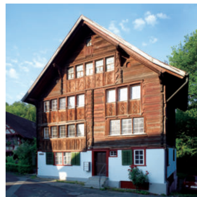
图6 左边是一个非常罕见的15世纪布尔高早期建筑的例子。右边是布尔高村庄广场上的2号房子（见以下解释）。共同特点是木结构和一排排带有向上滑动百叶窗的窗户。Burgau的房屋顶层的阁楼窗户仍然有像15世纪那样的老旧小玻璃窗