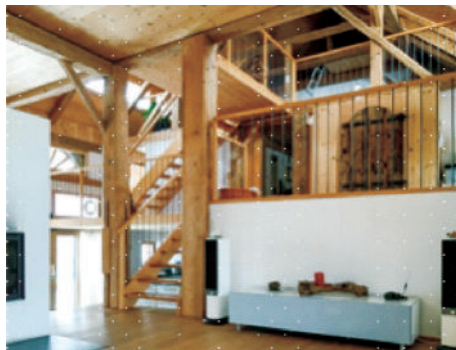
图30 改建房子的谷仓，第10号图