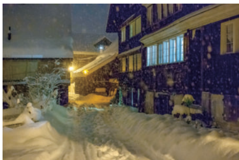
图15 建筑物的冬季氛围和夏季装饰

7) 1780年左右的两栋建筑。直接位于规划右侧街道上的大房子，由两栋共同建造的房子组成。窗户上有部分小