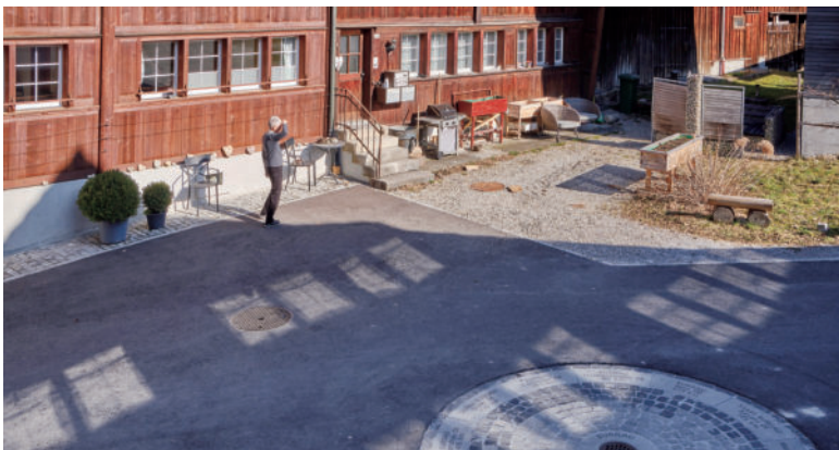
图31 村庄广场的日常使用