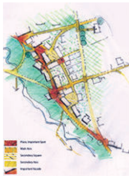
图23 分析，强调中轴线的 basic 功能