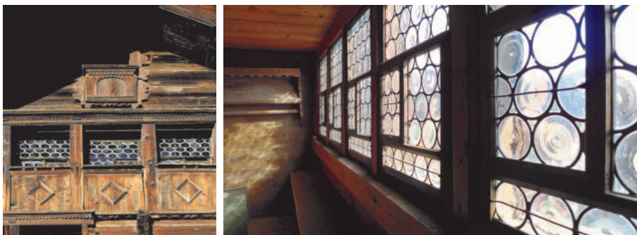
图10 阁楼外部和内部立面视图

今天这个村庄的特色建筑主要建于16世纪、17世纪和18世纪。他们用相对平坦的屋顶取代了早期、简陋和低矮的房子，屋顶的木质结构上面覆盖着石材瓦片。1700年左右开始的工业化，提供了越来越便宜的钉子，在大量使用钉子后，瓦片和后来的瓷砖都被稳稳地固定在建筑结构上，即使在更陡峭的屋顶上也是如此。为了得到更大空间，新的房屋面积更大，屋顶更陡峭。这种类型的屋顶，在阿尔卑斯山一带的丘地区，