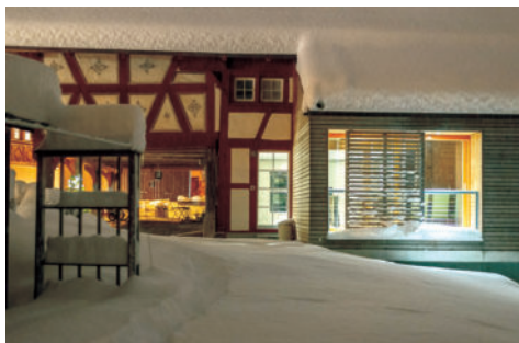
图27 法院的现代延伸，第4号图