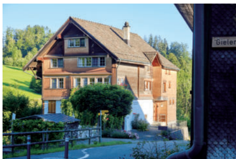
图16 南立面和带有旧文字的东立面细节