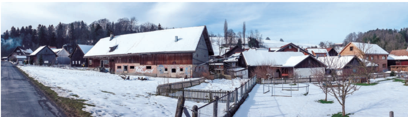
图19 2013年的布尔高，被废弃的建筑、奶酪作坊和马厩