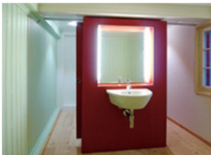
图28 浴室/卫生间，第2号图