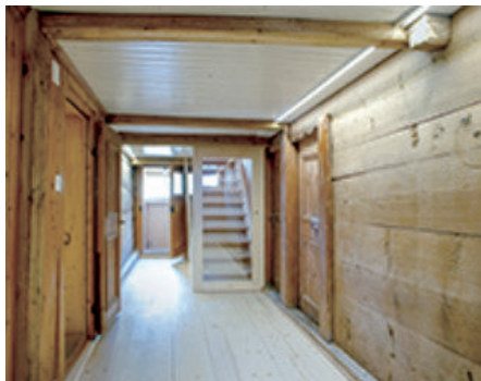
图29 房子的重建入口区域，第2号图