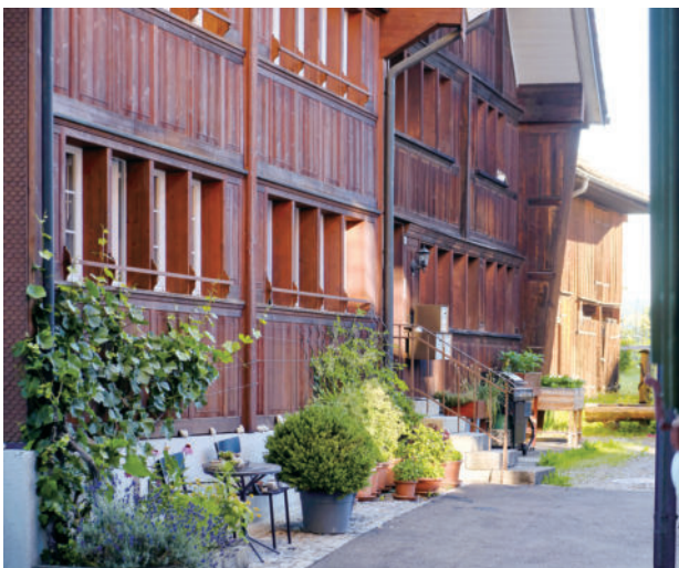
图11 村庄广场的主立面，重新设计的

图6展示的是，当地一家纺织品生产房间。通常建在这些房屋的地下室。今天许多地方仍然存在的狭窄窗户，见证了这一点。入口通常在侧面，有时是