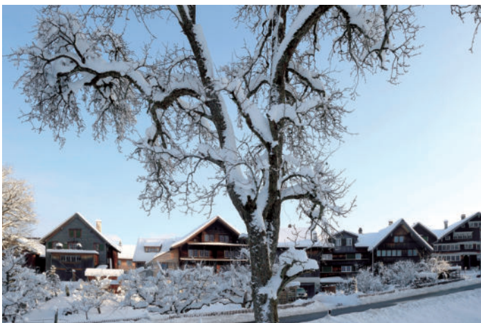
图2 从小河口看到的村庄西侧的居住区边缘