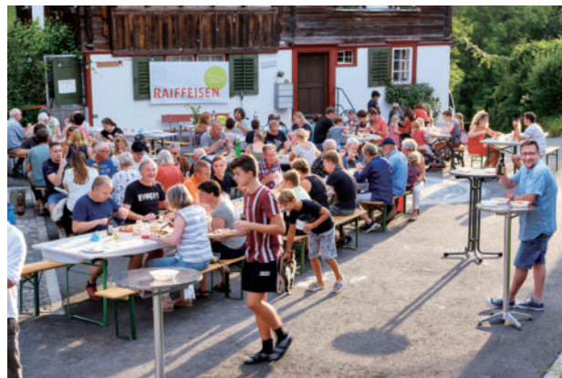
图32 布尔高居民在新设计的村庄广场上庆祝