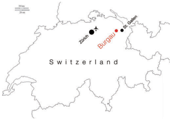
图3 布尔高被整合到瑞士城市网络范围内。前往圣加仑州中心，乘坐公共交通工具25分钟即可抵达，苏黎世国际机场大约一小时即可抵达