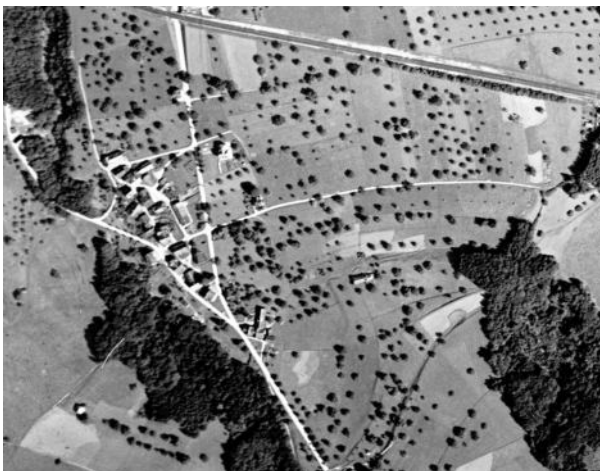
图4 1932年，在两条绕城道路建成后不久，Burgau位于一片田园风光的田里，鸟瞰图