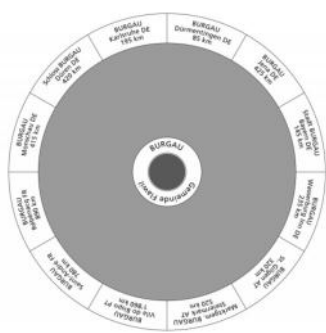
图26 广场的中心设计为一座纪念碑，纪念欧洲其他名为Burgau的12个地方。在圆的中心，可以嵌入一根用于各种目的的杆子