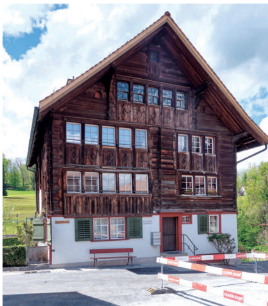
图9 村庄广场的原有主立面

对称布局。次级道路通向谷仓、马厩以及周围的田野和森林。1855年，新的圣加仑-苏黎世铁路线，切断了田野。20世纪初，为了应对日益繁忙的交通需求，修建了两条绕城道路。