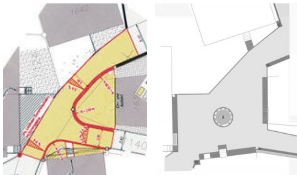
图25 村庄广场，原来规划为交通功能为主（左图）。后期，在设计者的干预下，做了适当调整，突出了广场的功能