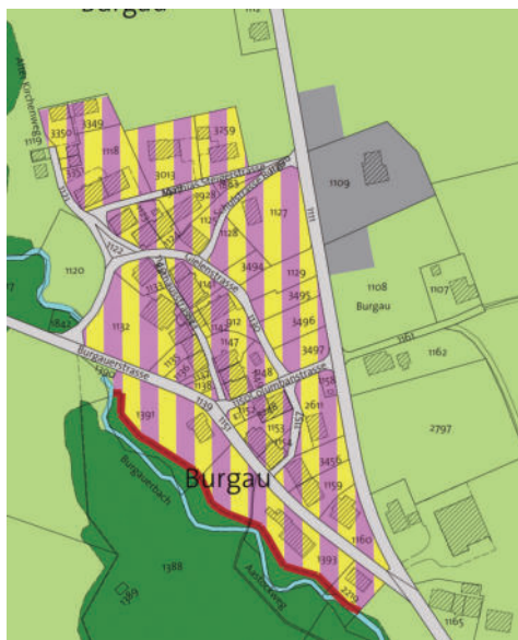
图21 实际土地使用计划：村里可以混合使用、住宅和非干扰工作。周边地区是农业区和森林（深绿色）。该计划对所有建筑项目都是强制性的。最多可以实现2层半的限高。建筑项目由公共设计委员会和州历史古迹保护共同管理