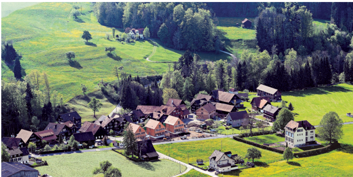
图1 Burgau 处于更新阶段。在背景中，沿着历史轴线的主要建筑；在前景中，在东侧可以看到正在进行的改造。2014年的鸟瞰图

街道形成一定角度。精心维护的花园里，三个村庄喷泉，涓涓流水；历史上遗留下来的谷仓，用新的木质建筑翻新，保留原有的风格。宛如明信片风光