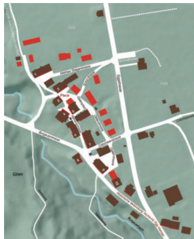
图5 1700年左右的布尔高(左)和2022年布尔高的比较。近年来建造的新住宅楼被标记为红色。主要取代谷仓、马厩和奶酪奶牛场，以及一些过去未开发的土地

的木质小村庄，留住了时光，村庄的一边通向一个小山谷；另外一边，是一条喃喃自语的溪流，名叫吉润（Giren），安静充满充满生机的Burgau山，绵绵延伸通向Appenzell山麓。