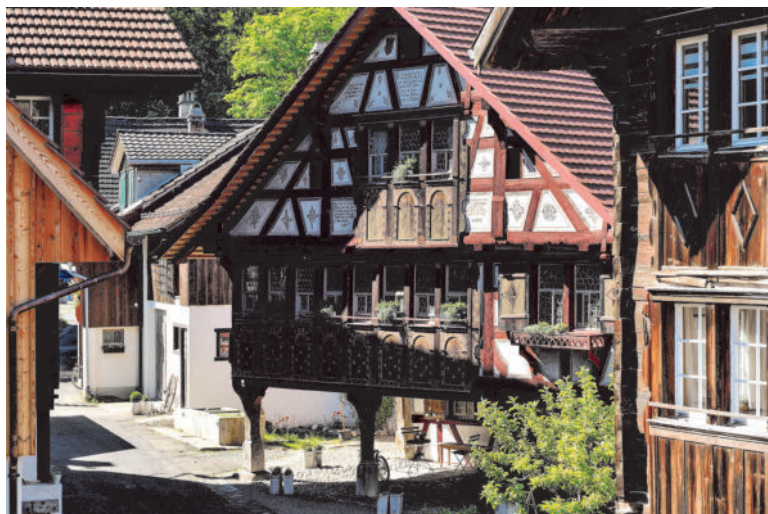
图12 小村庄内，轴线上的法院。在这里，街道空间的城市特征非常明显。在前景中，2号房屋在右边被分开